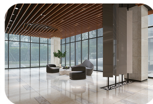
●宽敞开放的接待区