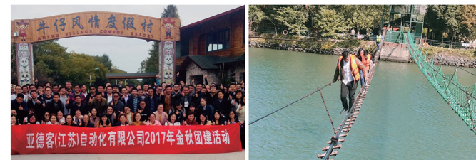
亚德客(江苏)自动化有限公司2017年金秋团建活动